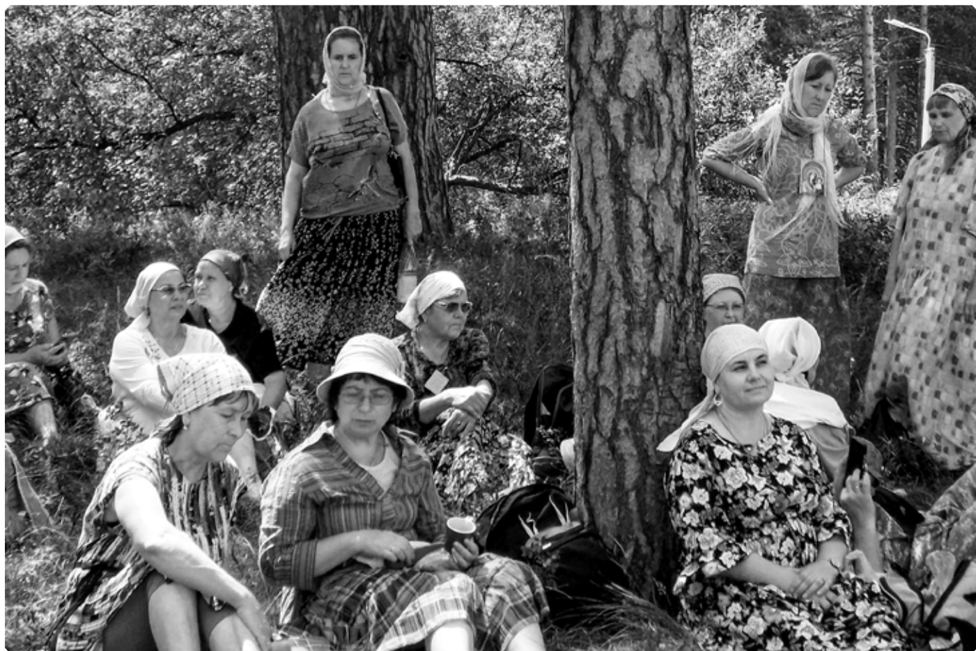
На привале. 24 июня 2022 г.