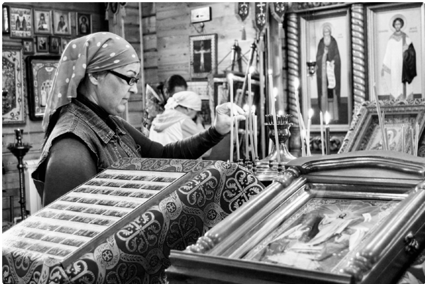
В храме преподобного Серафима. Поселок Линеvский. 25 июня 2022 г.