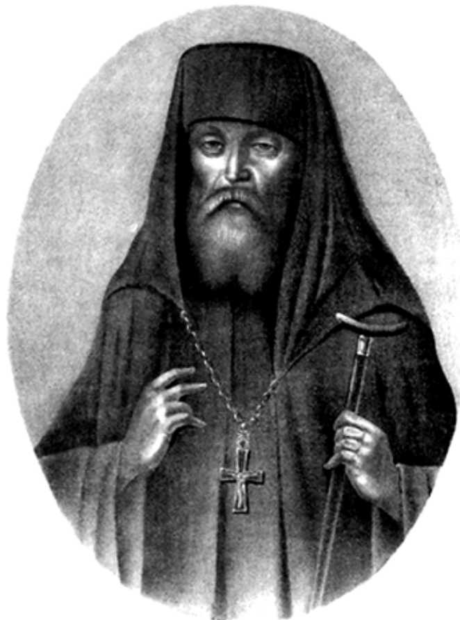
Портрет архимандрита Макария (Глухарёва). Литография. Около 1846 г. Копия. МАДМ.

«ОТ ТОМСКОЙ ДУХОВНОЙ КОНСИСТОРИИ. Села Яминского (ныне Целинного. – ред.), благоч. № 15, исправляющий должность псалом-