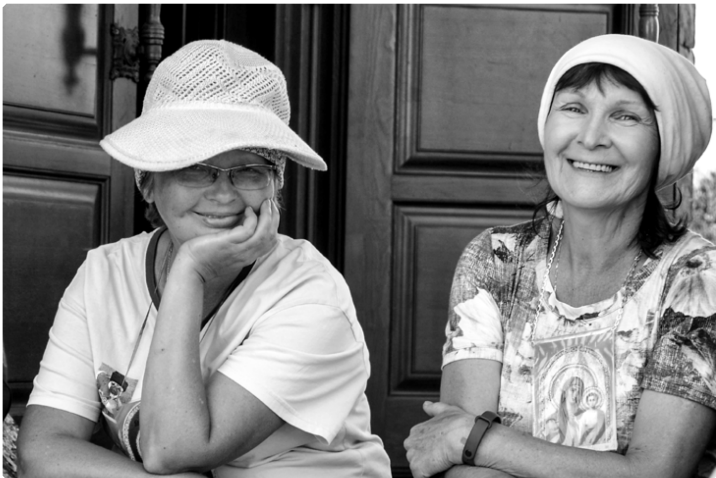
Утро в Линевском. 25 июня 2022 г.

из крестоходцев несет еще и свою собственную скорбь, свои просьбы к нашей Небесной Заступнице. Решение человека идти в крестный ход может даже казаться случайным, но это только на первый взгляд. Рассказывает Ирина, участница Коробейниковского крестного хода с 2010 года: