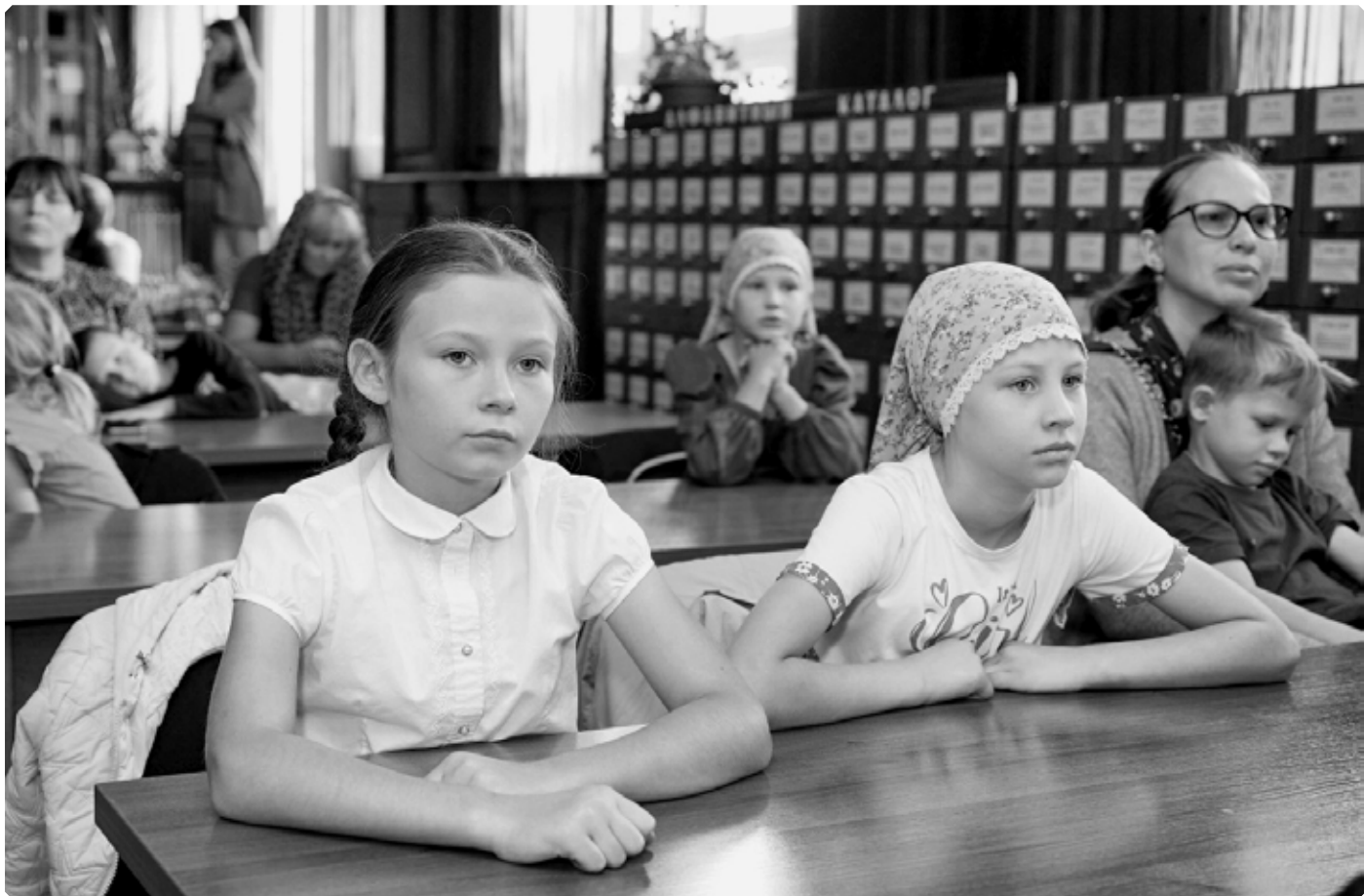
Главные участники кинофестиваля – дети. Библиотека им. В.М. Шукшина. Бийск. 20 августа 2022 г.

20 августа в Центральной городской библиотеке им. В.М. Шукшина прошел кинофестиваль «Храм глазами детей», состоявшийся при поддержке Конкурса малых грантов «Православная инициатива – 2022». Праздник детского кино стал финальным этапом одноименного проекта, разработанного и претворенного в жизнь отделом религиозного образования и катехизации Бийской епархии на базе Успенского кафедрального собора.