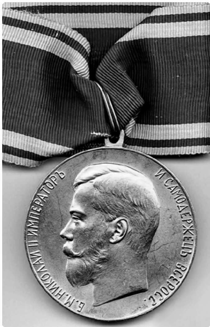
Серебряная медаль для ношения на шее на Станиславской ленте. На аверсе – профиль Императора Николая II. По кругу слова: «Божией милостию Николай II, Император и Самодержец Всероссийский». На реверсе – пальмовая, лавровая и дубовая ветви с надписью «За усердие»