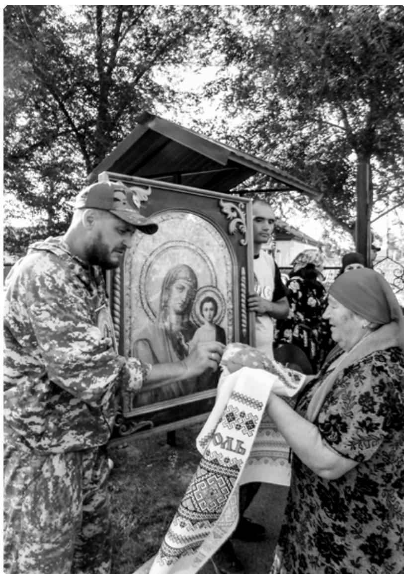
Встреча в поселке Линеvском. 24 июня 2022 г.

С самого первого дня я задавался вопросом: что побуждает людей оставлять свои дела и идти пешком столько дней, терпя бытовые неудобства, усталость, а порой и физическую боль? Казалось бы, всё просто: православные верующие люди сообща идут с молитвой к особо чтимой чудотворной иконе Пресвятой Богородицы. На самом деле, каждый