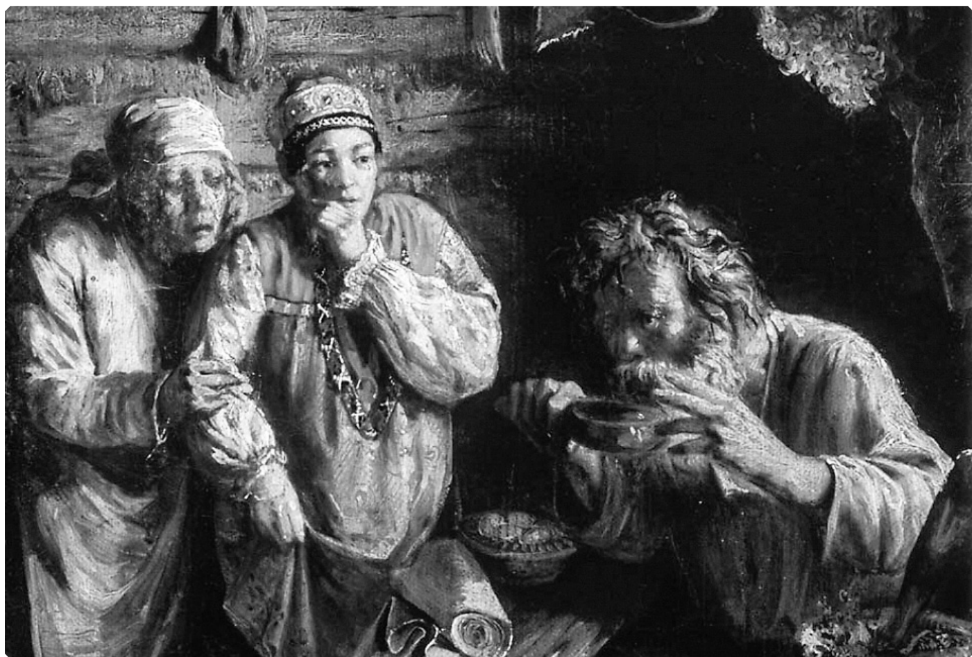
Григорий Мясоедов. Деревенский знахарь. Фрагмент. 1860 г. Холст, масло. Саратовский государственный художественный музей им. А.Н. Радищева.