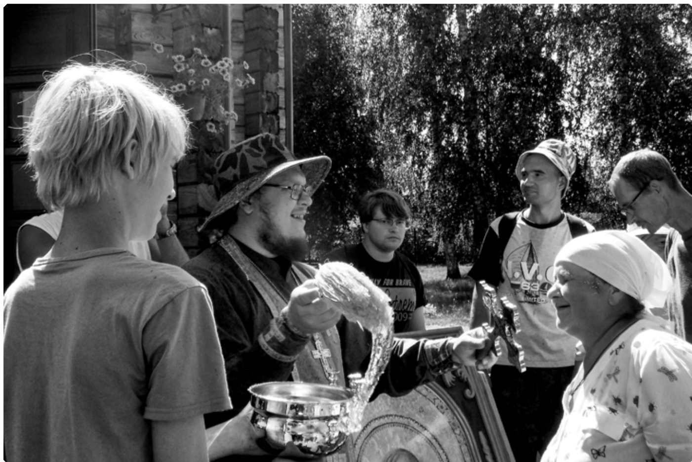
Водосвятный молебен. Поселок Линевский. 25 июня 2022 г.