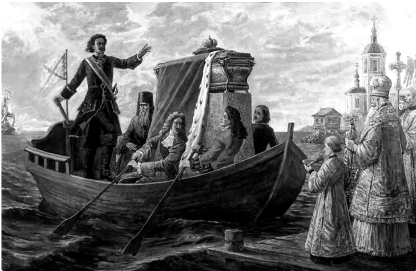
Филипп Московитин. Перенесение мощей святого князя Александра Невского императором Петром Великим в Санкт-Петербург. 2001 г. Холст, масло.

Свято-Троицкая Александро-Невская лавра.