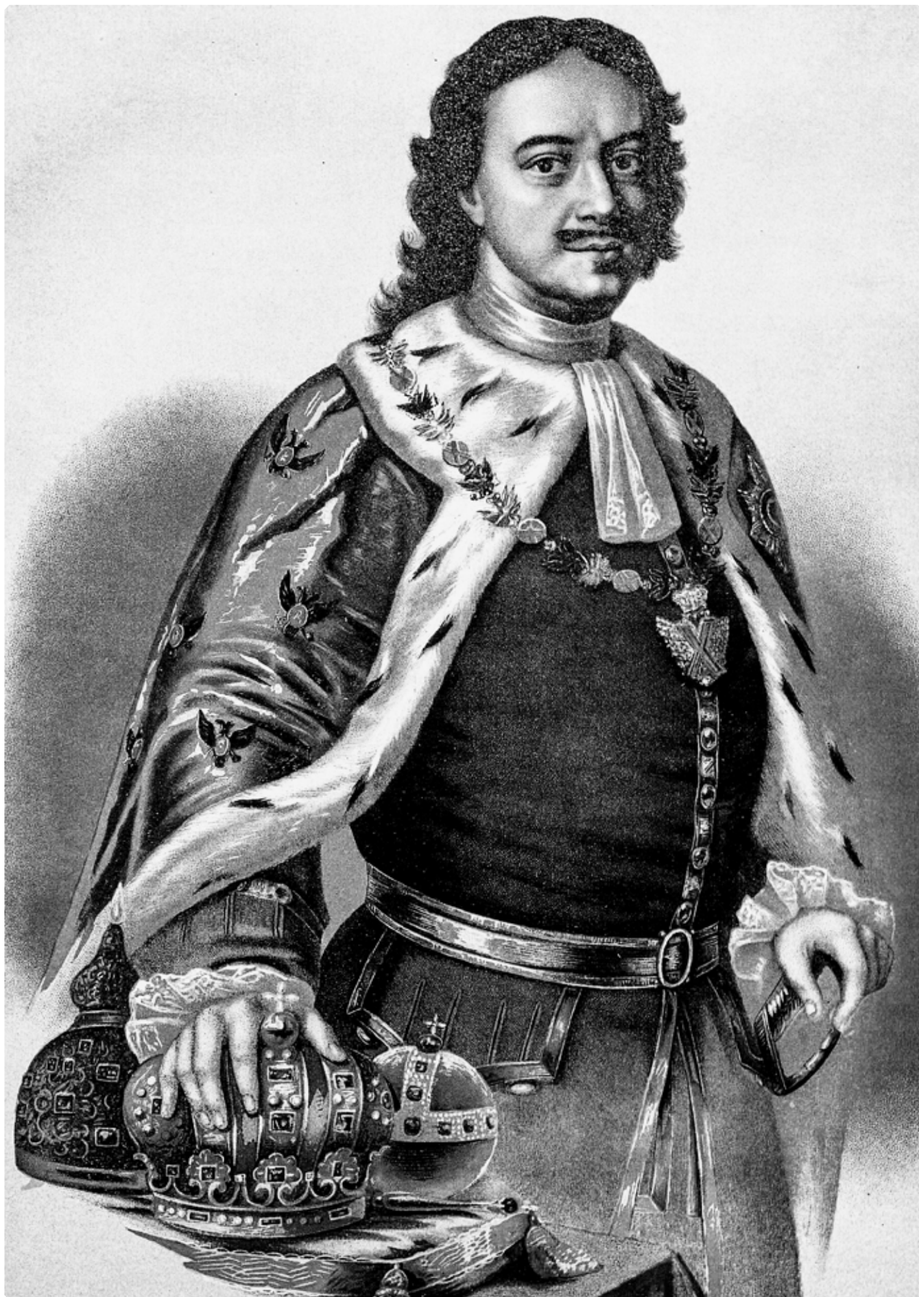
Петр Великий. Император и Самодержец Всероссийский. Родился 30 Мая 1672 г., вступил на престол 28 Апреля 1682 г., скончался 28 Января 1725 г. Хромофотография Р.В. Хорн. Издание К.А. Бороздина. С.-Петербург. Дозволено цензурой 18 ноября 1894 г.