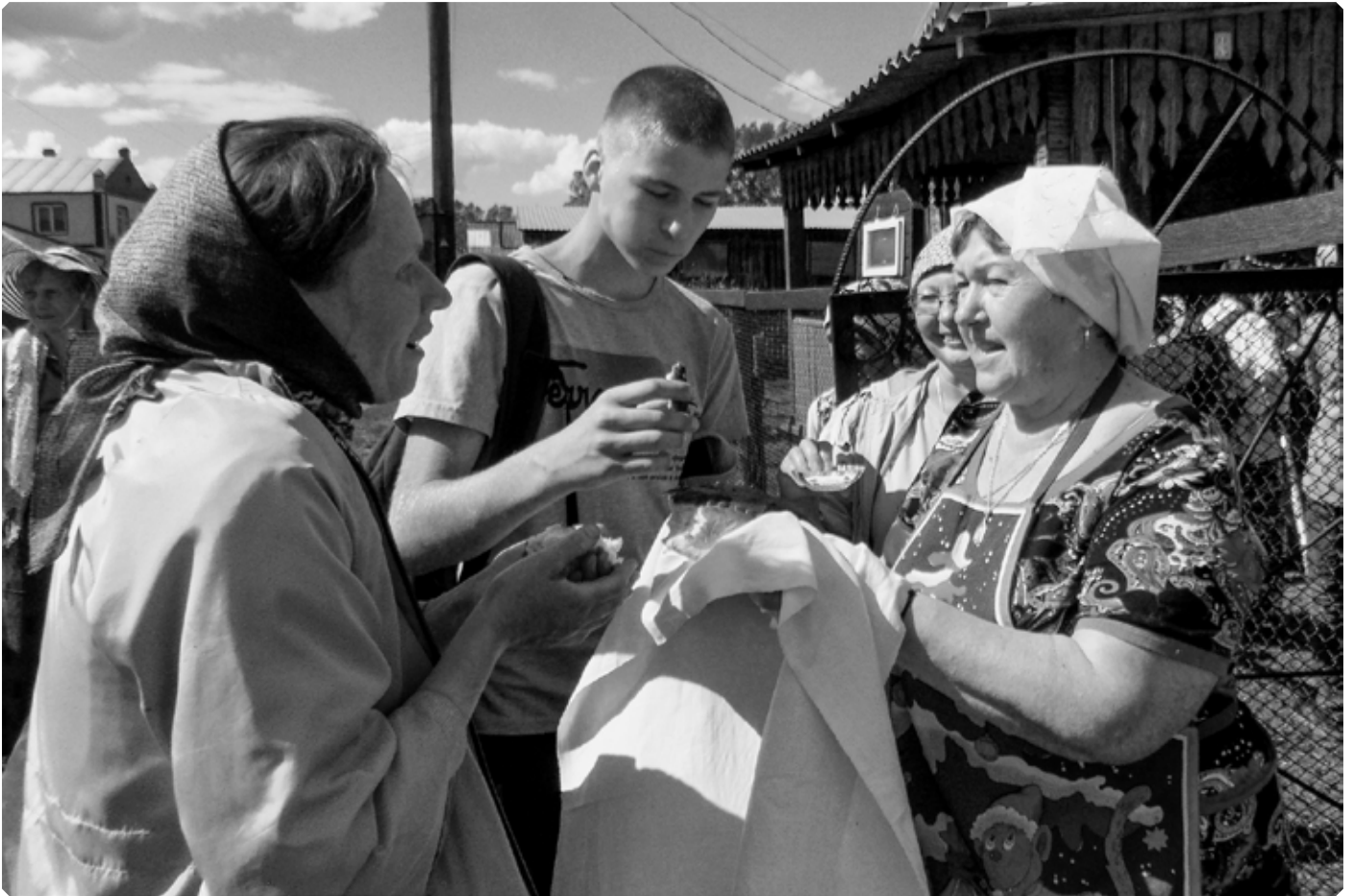
Встреча в селе Катунском. 24 июня 2022 г.