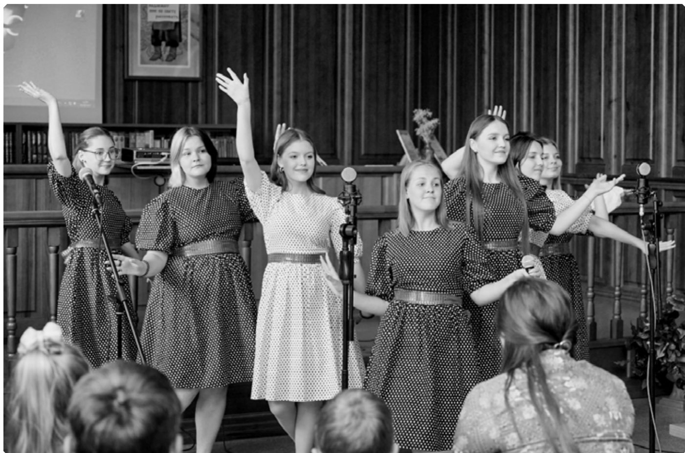
Выступление вокально-хорового ансамбля «Радость» храма Покрова Божией Матери (БПО «Сибприбормаш»). Библиотека им. В.М. Шукинина. Бийск. 20 августа 2022 г.

Иван Литвинов