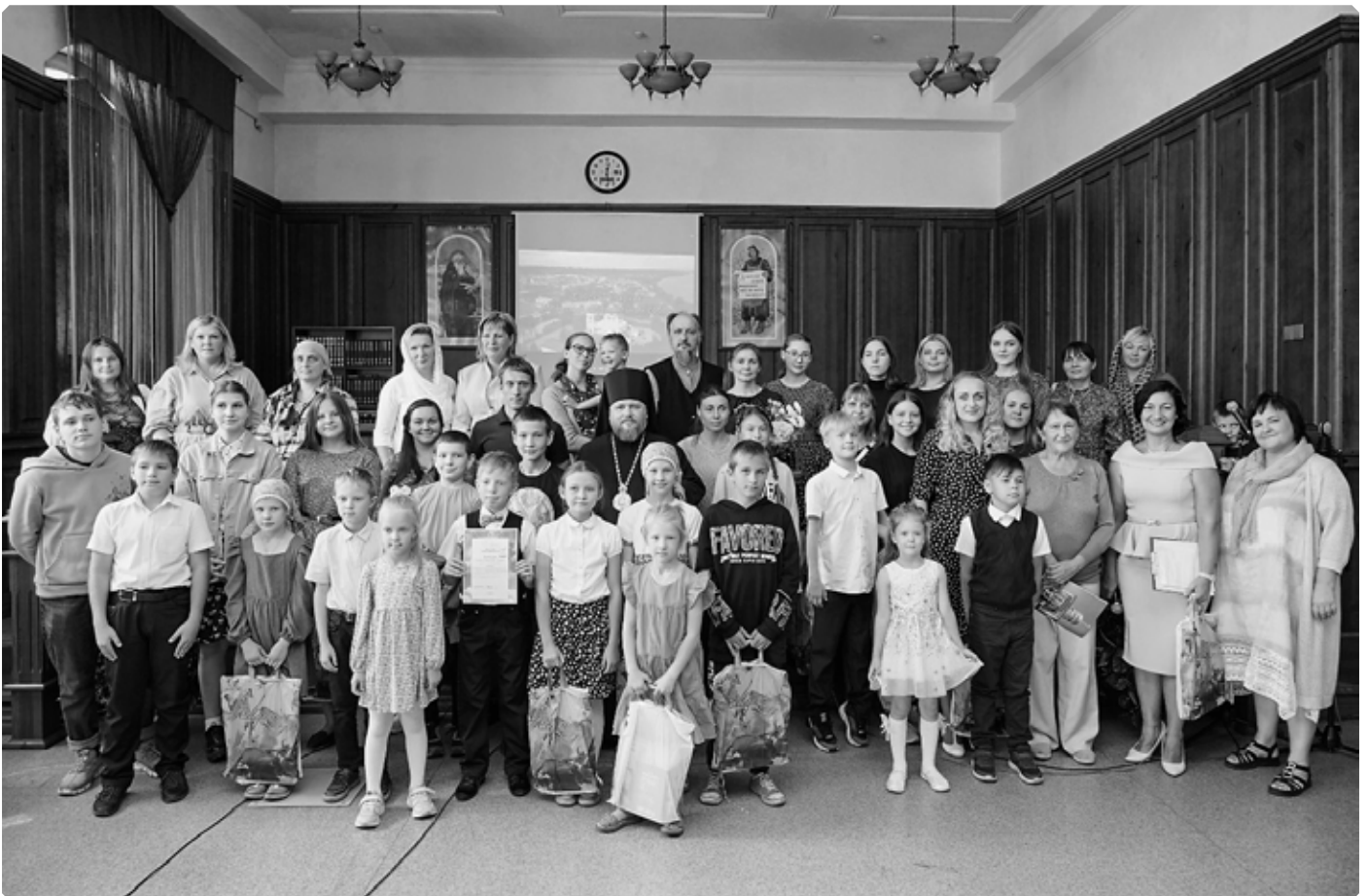
Организаторы и участники кинофестиваля «Храм глазами детей». Библиотека им. В.М. Шукиина. Бийск. 20 августа 2022 г.