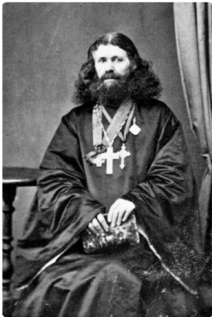
Протоиерей Александр Иванович Сулоцкий (1812–1884) – историк, краевед, исследователь истории христианства в Сибири. 1860-е гг. Омск

Этот период отмечен важным для молодого священника духовным обстоятельством: он вошел в переписку с епископом Феофаном (Говоровым), святителем Феофаном Затворником. Представление о значимости этой переписки можно